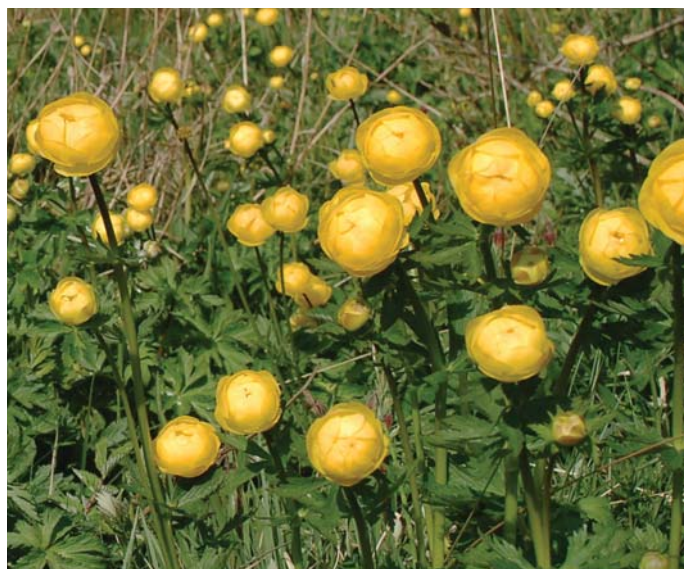
Engblommen er gået meget tilbage og findes nu kun enkelte steder i Kommunen.

Strategien er forankret i Teknik og Miljø, Team Natur og Landskab. Der søges i vid udstrækning samarbejde med såvel interne som eksterne samarbejdspartnere. Interne samarbejdspartnere er f.eks. Team Vej & Park, Vej, Park & Genbrug, Udvikling & Erhverv. Eksterne samarbejdspartnere er Natur- og Kulturvejlederen ved Sønderkov, landbrugets organisationer, Naturstyrelsen, grønne organisationer, markvildtlaug, lokalråd, grundejerforeninger m.fl.