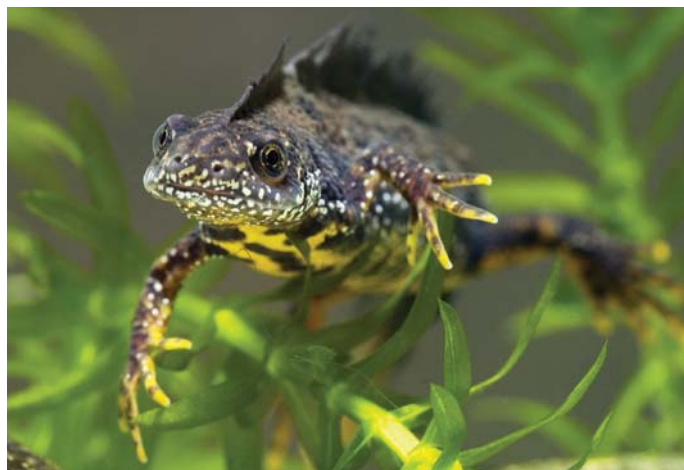
Stor vandsalamander findes i rene vandhuller.

Vejen Kommune vil gerne tage et medansvar for at bremse tabet af biodiversitet. Kommunen underskrev i 2008 Countdown 2010-erklæringen om at stoppe eller væsentligt reducere tabet af biodiversitet. Nogle af de konkrete projekter, der udsprang af denne erklæring, er indsatsplanen for bekæmpelse af kæmpe-bjørneklo og flere naturplejeprojekter.