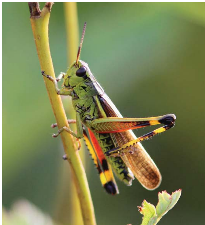
Sumpgræshoppen findes i enkelte ådale i Kommunen

Det skal tilstræbes, at driften af de kommunalt ejede arealer foregår så den hjemmehørende flora og fauna tilgodeses bedst muligt. Det betyder bl.a., at skovene bliver drevet naturnært, så stormfældede træer får lov til at ligge til glæde for svampe, insekter og fugle. Det betyder også, at grønne arealer bliver klippet sjældnere, så der bliver mere plads til, at vilde urter kan nå at blomstre, hvorved der bliver mere føde til de vilde bier og andre insekter. Det indtænkes i planlægningen af nye grønne områder, at der plantes/sås hjemmehørende planter, som har en god værdi som foderplanter for insekter og fugle.