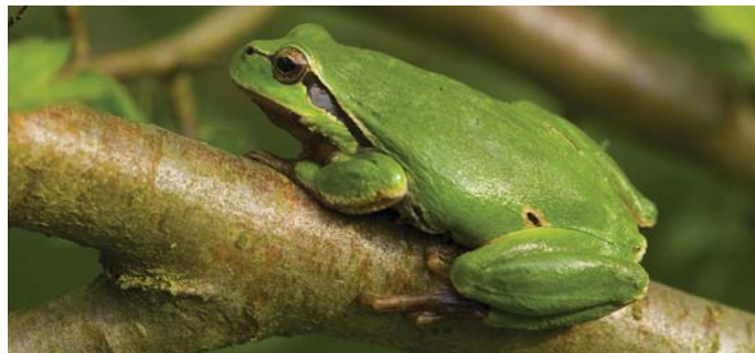
Løvfrøen er sjælden og findes kun enkelte steder ved Jels.

Hvis der skal iværksættes større projekter, vil de blive finansieret via eksterne midler.