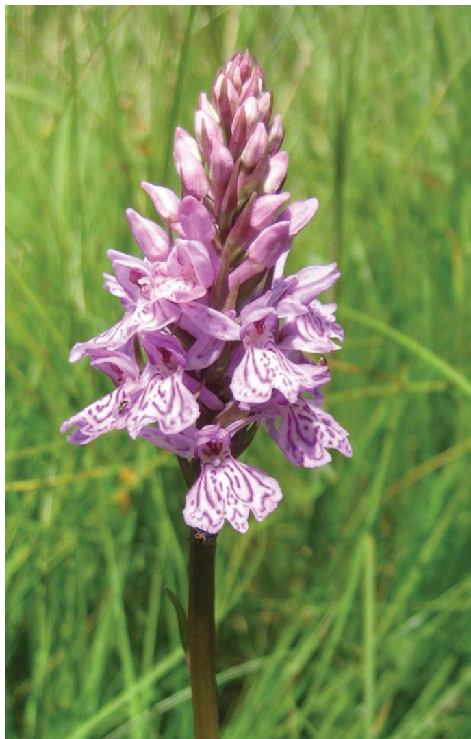
Plettetgøgeurt er en fredet orkide og tegn på en god naturtilstand.

Arbejdet med at bekæmpe Kæmpebjørneklo blev sat i gang som følge af, at Vejen Kommune tiltrådte Countdown 2010-erklæringen. Kæmpebjørneklo er en trussel mod biodiversiteten, hvorfor den skal bekæmpes.